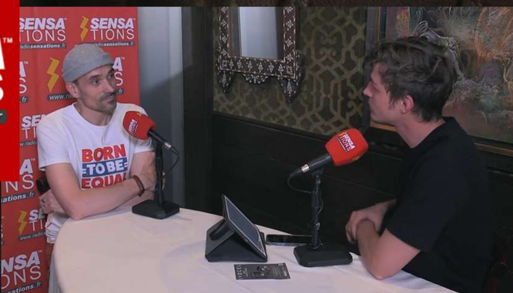
ITW Radio Sensations