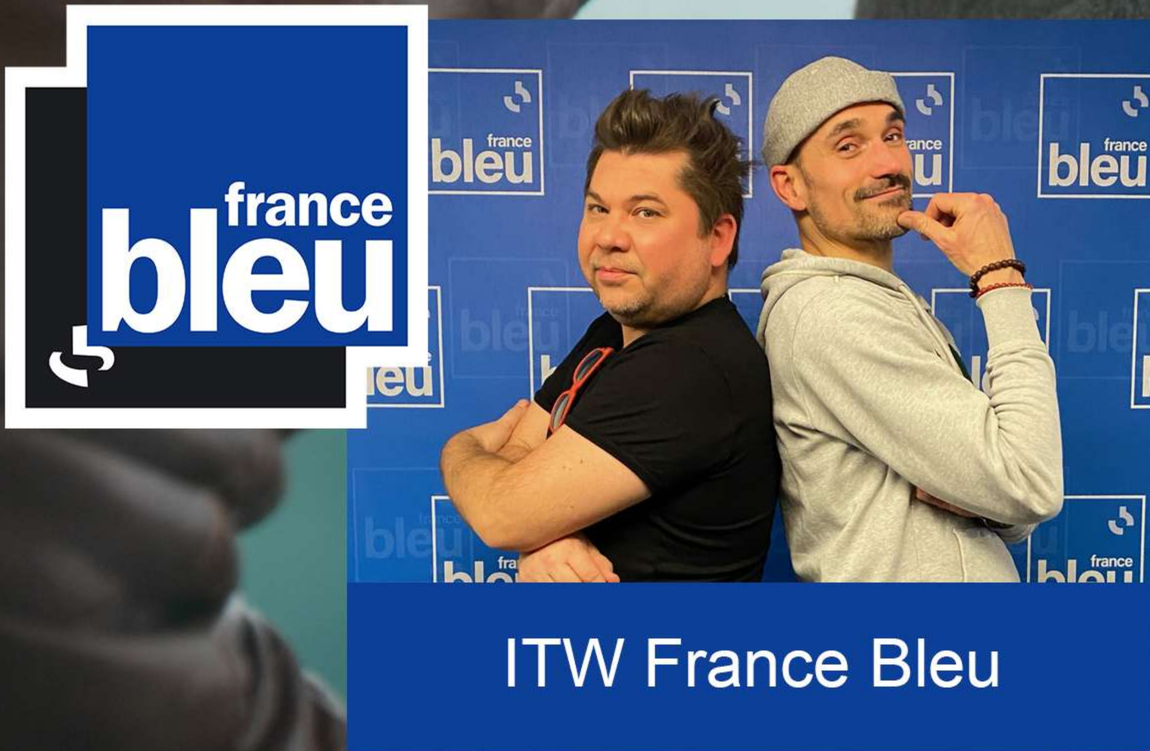
ITW France Bleu